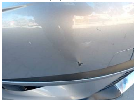
Bouclier avant (Impact)