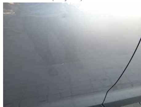
Porte arrière droite (Rayure)