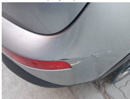
Bouclier arrière (Rayure)