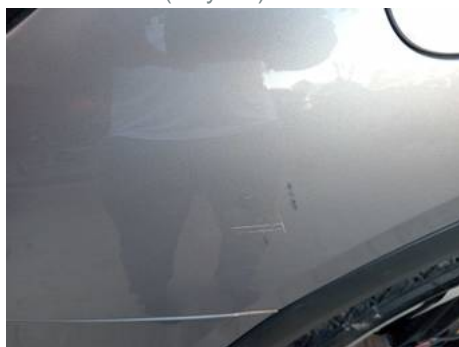
Aile arrière droite (Rayure)