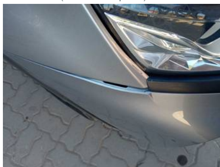
Bouclier avant (Défaut aspect)